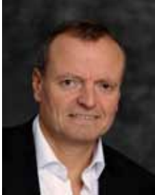
Prof. Dr. Dr. Manfred Spitzer Universität Ulm

Eine der großen Herausforderungen dieser Zeit für Unternehmen stellt die Sicherstellung der Leistungsfähigkeit sowie die optimale Nutzung der Potenziale der Mitarbeiter dar. Prof. Spitzer präsentiert neue und andere Antworten auf diese Herausforderungen vor dem Hintergrund der Gehirnforschung. Nach einer kurzen Einführung in einige Grundprinzipien der Gehirnfunktion wird es unter anderem um Fragen wie die folgenden gehen: